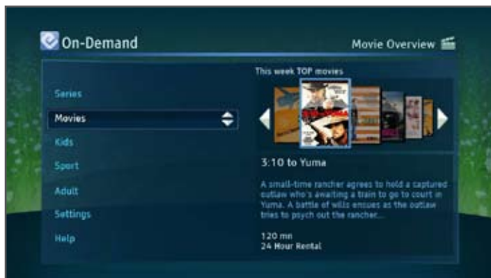
Рис 4. Контент в каталоге «по запросу» организован по определенным группам: каналы, жанры, «ТОП 10», что позволяет пользователю быстро найти интересующую программу

Оператор может пакетировать контент абсолютно любым способом и с легкостью предоставлять различные бизнес модели, включая плату за просмотр (pay per view), пакет событийного контента (event package) или подписку без перекодирования контента.