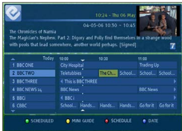
Рис 1: Адаптированный по индивидуальному дизайну EPG предлагает абонентам подробную программу передач на местном языке и с учетом местного времени.