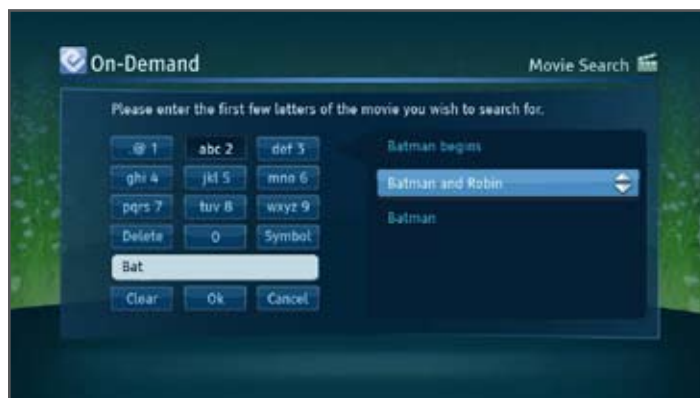
Рис 5: Функция «Поиск контента» дает пользователю возможность ввести часть названия программы или фильма и посмотреть возможные соответствия.

дает возможность превратить обычный вебсайт в видео портал премиум класса при помощи любой технологии веб дизайна: HTML, Adobe Flash и Microsoft SilverLight.