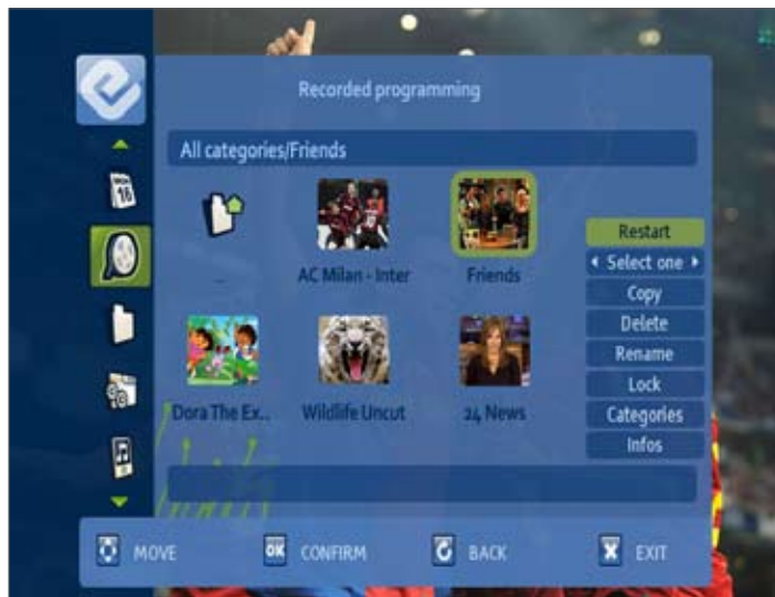
Рис. 3: Абоненты могут с легкостью организовывать, редактировать и просматривать записанный контент через медиа библиотеку.